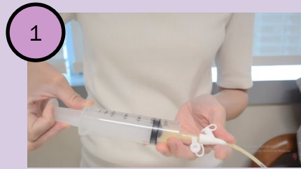
Melakukan pengecekan sisa makanan