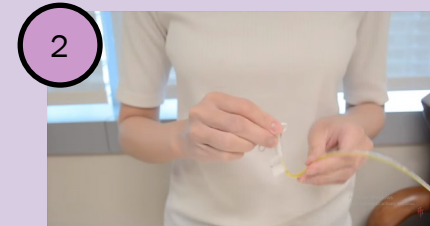
Menekuk selang untuk menutup jalur masuk udara